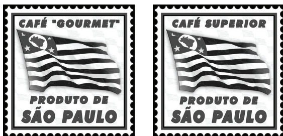
Figura 1 - Selo do Sistema de Qualidade de Produtos Agrícolas, Pecuários e Agroindustriais do Estado de São Paulo para café Gourmet e Superior.

discussões adiantadas sobre normas para certificação. Apoiando-se em trabalho técnico desenvolvido pelo Instituto de Tecnologia de Alimentos (ITAL) 6 , foram criadas de três categorias de produto: gourmet, superior e tradicional (SÃO PAULO, 2007a, b, c), sendo que apenas aos dois primeiros tipos seria permitida a rotulagem da embalagem com o Selo Produto de São Paulo (Figura 1).